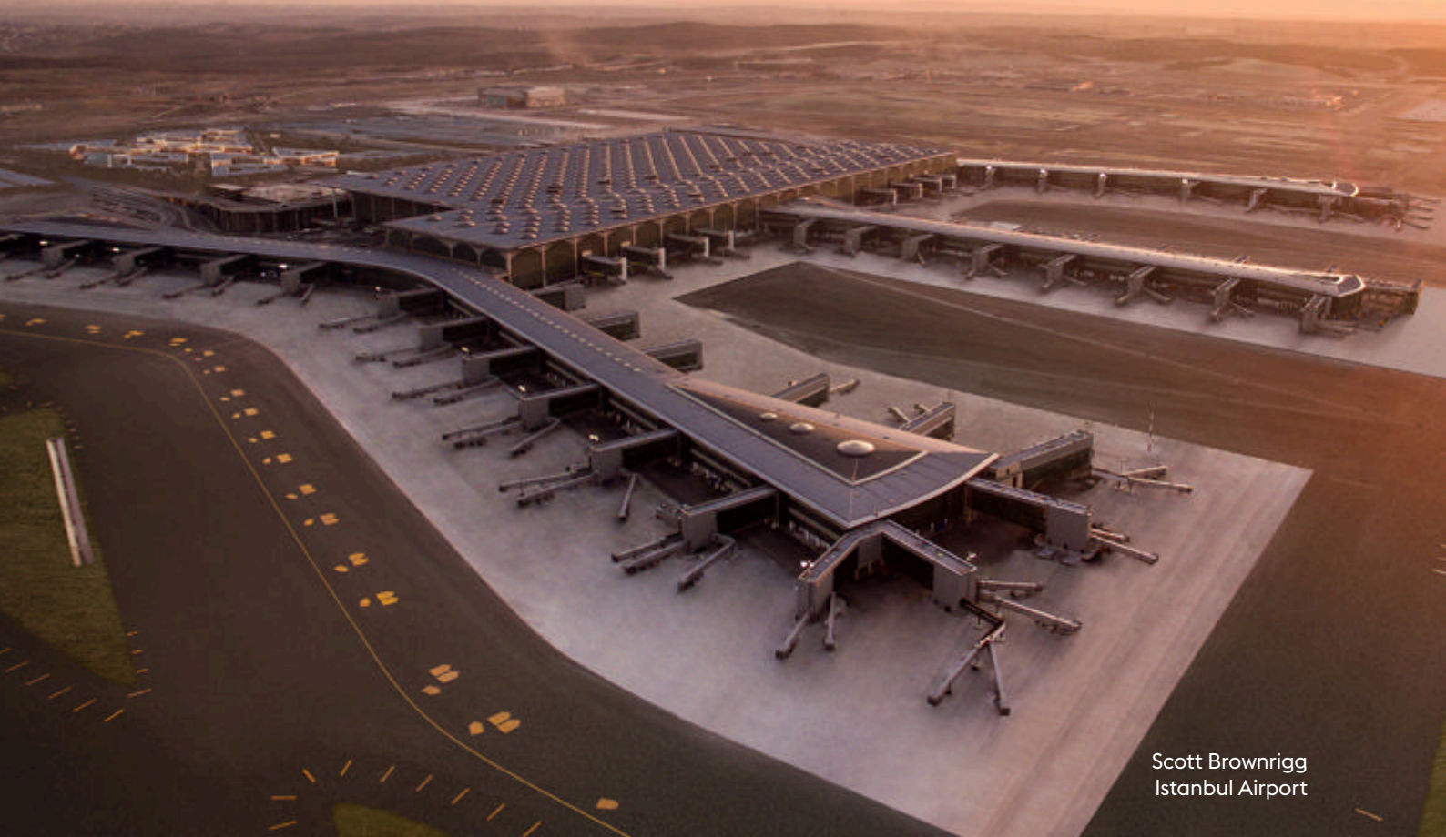
Scott Brownrigg Istanbul Airport

英国机场集团 (BAG) 为全球机场应对挑战提供世界级的专业技能与服务。我们是全球客户链接英国航空业公司的首站。英国企业为广大机场 (无论大小) 提供优秀的解决方案。我们在超过150个国家承接项目并取得了巨大的成功, 帮助了世界规模最大的60个机场获得价值、效率、可持续性 & 韧性的提升。